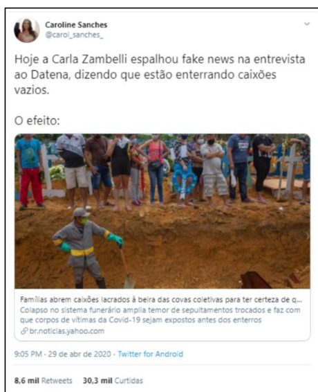
Figura 1 – Texto 1