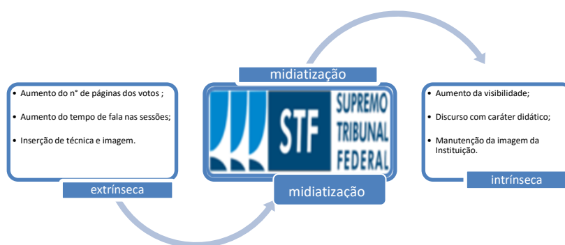
Figura 3. Esquema da nova forma de persuasão do STF na retórica midiaticizada

Depreende-se, portanto, que a TV Justiça aliada a outros meios de comunicação, promove a visibilidade e o protagonismo da Suprema Corte que transformou não apenas a visão do Supremo, porque o fez conhecer a si mesmo com sua própria audiência, mas também fez com que o Brasil conhecesse seus ministros e de como é feita a justiça. Assim, se no passado era, segundo Baleeiro, um “outro desconhecido” e um órgão eminentemente técnico, com atividade voltada apenas à comunidade jurídica, hoje admite nova forma de persuasão 4 , que abrange toda a sociedade, conforme demonstramos a seguir as relações intrínsecas e extrínsecas entre a mídia e o Supremo Tribunal Federal: