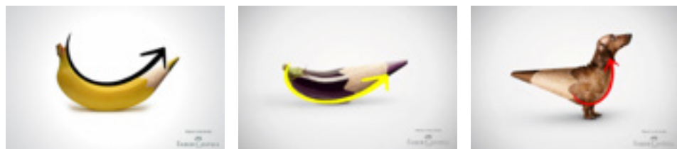
Figura 3 Uso da curva na campanha

Todas as formas básicas possuem três direções visuais básicas e são essas direções que dão sentido à elas. Observa-se nos cartazes também a curva, que é uma das direções do círculo. Para Dondis (1991) a curva tem grande importância para o significado da peça. Nos cartazes abaixo percebemos o uso da curva, trazendo estabilidade nas peças.