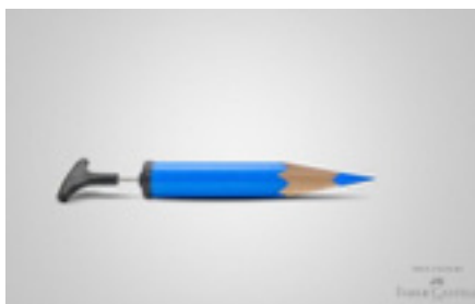
Figura 1 Cartazes da Campanha "Cores Reais" da Faber Castell

A fim de atingirmos nosso objetivo principal de pesquisa, detectamos a necessidade de hierarquizar as informações das peças da Campanha Cores Reais da Faber Castell, pois tornou-se importante identificar e analisar os elementos estético-formais do layout, para compreender como eles são adequados ao público consumidor do produto anunciado e compreender sua relação com o estilo minimalista.