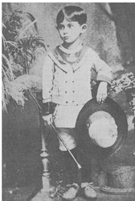
Figura 1. Retrato de Kafka ainda menino e a manifestação de uma solenidade técnica.