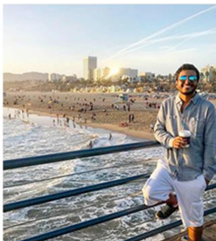
Figura 2. Exemplo de retrato contemporâneo, evidenciando liberdade e despojamento técnico.

As fotografias eram sim "paisagens impregnadas de estados afetivos"(Benjamin, 1994, p. 94), mas talvez tenhamos somente agora a devida liberdade para priorizar tais afetos na produção das imagens.