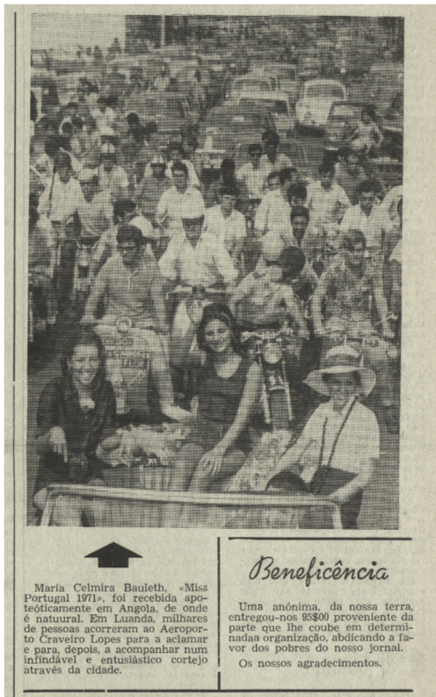
Figura 2 - Notícias de Gouveia, 3 de julho de 1971, p. 2

Quanto às cantoras, são identificadas pelo nome artístico, como aliás é comum no campo do espetáculo. Aqui devemos realçar o caso de Tonicha, uma das presenças confirmadas nas festas de Vila Nova de Tazem, que surge na capa, como destaque fotográfico. No entanto, na notícia que figura no interior, a fotografia escolhida é do artista masculino Hugo Maia Loureiro, como se a mulher funcionasse aqui