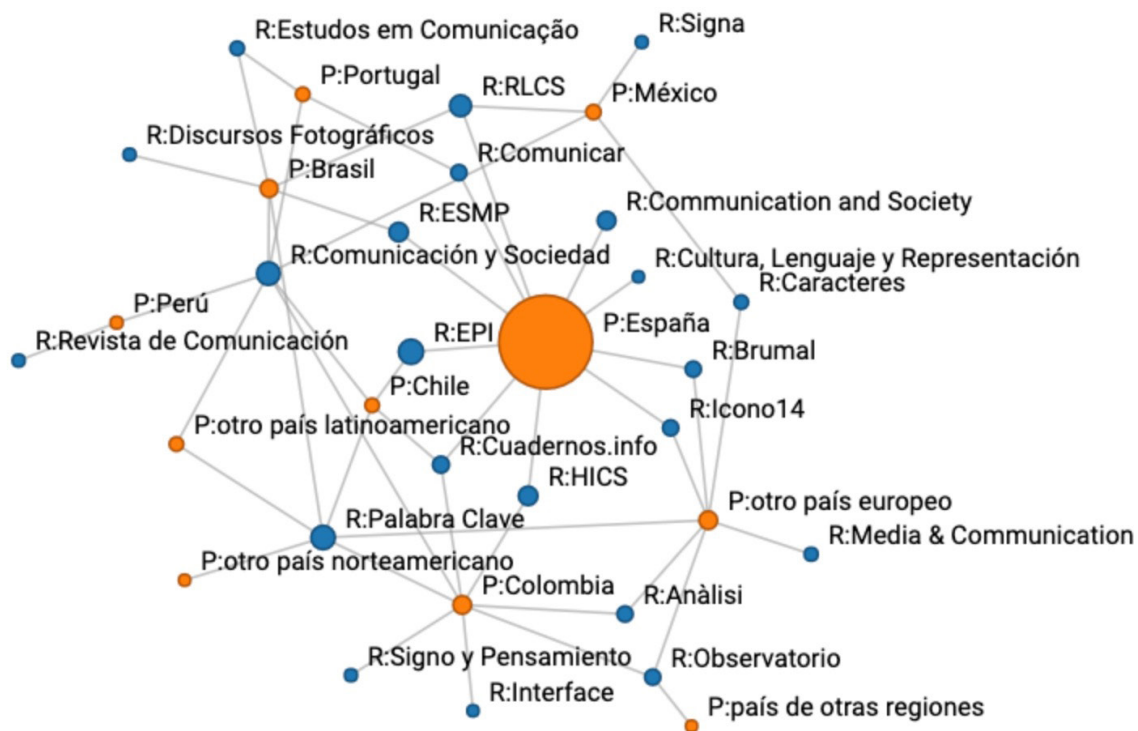
Gráfico 2. Redes establecidas entre los países de origen de las universidades y las revistas.