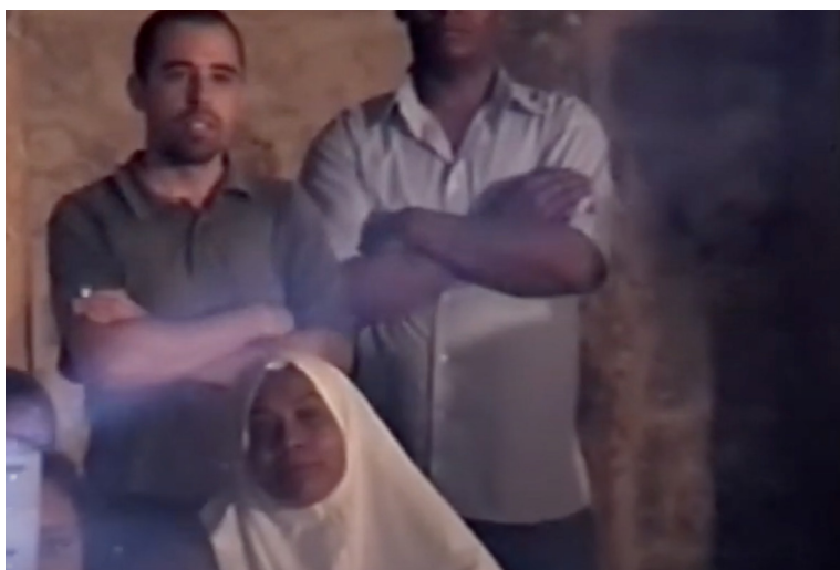
Figura 5: Cinema mudo

J.S.C.: O debate no bairro reuniu jovens palestinianas e alguns homens adultos, não havia rapazes nem crianças. As jovens, na maioria frequentavam a universidade e tinham uma perspectiva educativa das novas gerações e de futuro. Na sequência do debate, no filme, referem que graças às imagens das oficinas de expressão no filme, confirmaram “o potencial criativo” que existe no bairro e que mesmo sem as crianças falarem, “os desenhos falam” e qualquer coisa que as crianças desenhem é de uma “beleza extraordinária”. Como se as imagens das pinturas infantis oferecessem portais de percepção que quebravam com os textos identitários e ideológicos repisados. Do lado judaico, o debate realizou-se com jovens adultos ligados a movimentos pró-palestinianos ou à organização de Arting Jerusalem . Descreveram-me a simetria da violência e de como no lado privilegiado judaico, o terror dos ataques bombistas, a recorrência de perdas de amigos e familiares em acontecimentos violentos, o trauma em que as crianças cresciam alimentava a tensão quotidiana e um estado de doença social que é real e partilhado pelos dois lados do conflito (em condições inegavelmente desiguais).