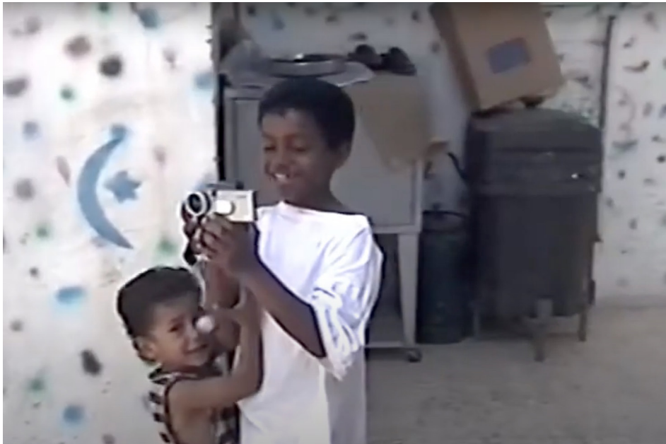
Figura 2: Cinema mudo