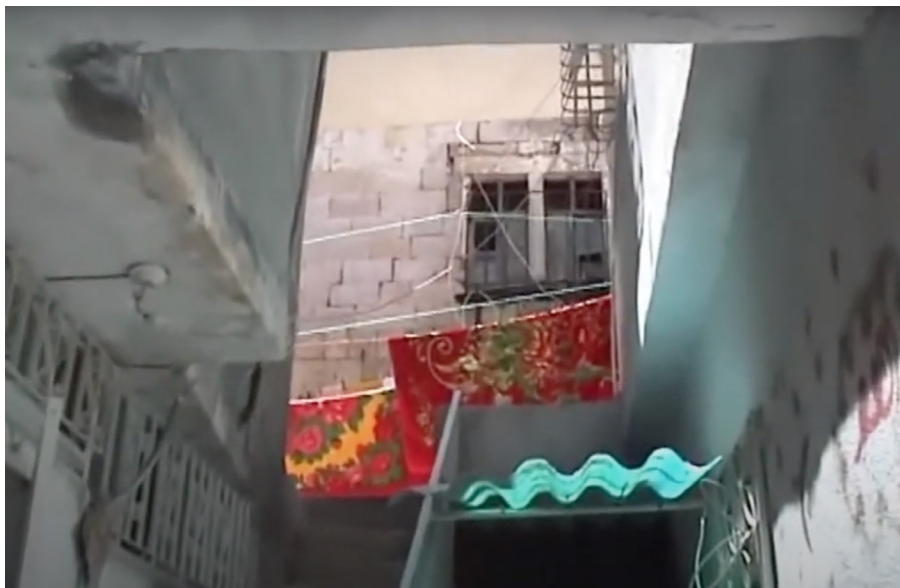
Figura 3: Cinema mudo

A.M.: Como é que os habitantes reagiram à proposta de filmar aspetos exteriores do bairro e do interior das suas casas?