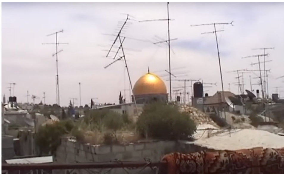
Figura 1: Cinema mudo

Também organizei, no centro de ocupação de tempos livres do bairro (ou noutras ocasiões nos corredores entre as casas), uma série de três tardes de oficinas de expressão plástica com as crianças do bairro, pedindo que desenhassem com marcadores e lápis de cera, em folhas de papel, o bairro, a casa de cada um especificamente ou o seu quarto. Filmei as crianças enquanto desenhavam e o filme integra essas sequências cheias de cor e vitalidade, com algumas crianças a desenharem enquanto comem um gelado, ou a rodarem a folha de papel sucessivamente enquanto desenhavam até completarem uma rotação de 360°, uma criança a segurar na folha de outra ou duas crianças a debaterem-se pelo mesmo lápis de cera. A filmagem permite assistir ao raciocínio infantil em ato (o gesto decidido com que uma linha divide um espaço na folha, o ritmo com que se pinta o espaço interior de uma forma ou a naturalidade com que algumas crianças passaram da pintura sobre a folha para as unhas, o braço ou a cara) sem retórica. Compreendemos os modos de pensar o lugar de habitação, apenas observando o ato do desenho e da pintura.