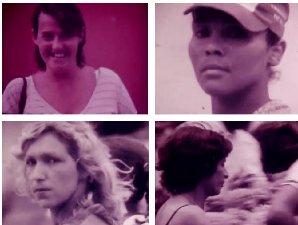
Figuras 9, 10, 11 e 12: Da indiferença ao enfrentamento: as várias formas de jogar com a câmera ( Mulheres da Boca , 1981).