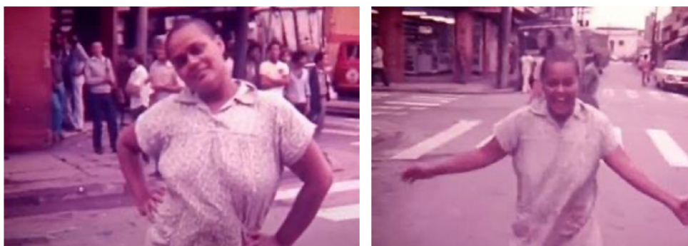
Fig. 7 e 8 – A personagem dança com a câmera ( Mulheres da Boca , 1981).

propor os seus próprios termos de aparecimento. A personagem quer ser vista e, na consecução de sua vontade, escolhe mostrar-se feliz e em liberdade, fissurando expectativas espetatoriais.