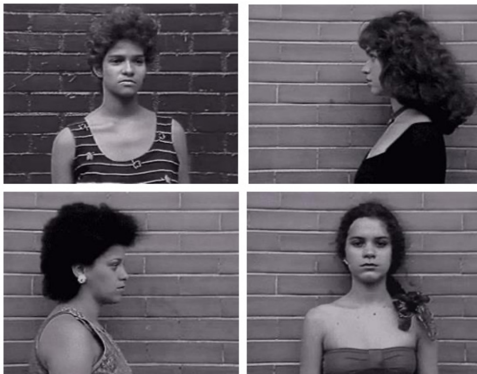
Fig. 3, 4, 5 e 6 – As fotografias que ecoam registros fotográficos policiais, ensejando aproximações imagéticas da prostituição com o mundo do crime, sem que haja qualquer tensionamento crítico dessa relação ( Meninas , 1989).

Meninas (1989), de Melo, realiza uma operação similar, buscando evidenciar sonhos frustrados e extrair informações sobre os hábitos peculiares e as dinâmicas dos programas de suas personagens – pretende-se compreender os significados que as garotas atribuem à virgindade, como manejam o uso preservativos e como lidam com presumíveis perigos. A analogia à criminalidade fica por conta, principalmente, de uma série fotografias das jovens – que se posicionam de frente e de perfil para as lentes da diretora – evocadoras dos registros policiais feitos em suas costumeiras apreensões. Melo também recorre, no início do documentário, a uma câmera pornovoyeurista, que observa de longe as interações entre prostitutas e clientes, utilizando o contraste do plano sonoro – La Vie en Rose , de Édith Piaf – para reiterar as dissonâncias entre aquilo que se escuta – o elogio ao amor romântico – e aquilo que se vê – a denúncia do amor venal. Aliás, toda a trilha direciona recepcionamentos: “não há saídas, só ruas, viadutos e avenidas”, sentencia a letra de Itamar Assumpção, que arremata o documentário.